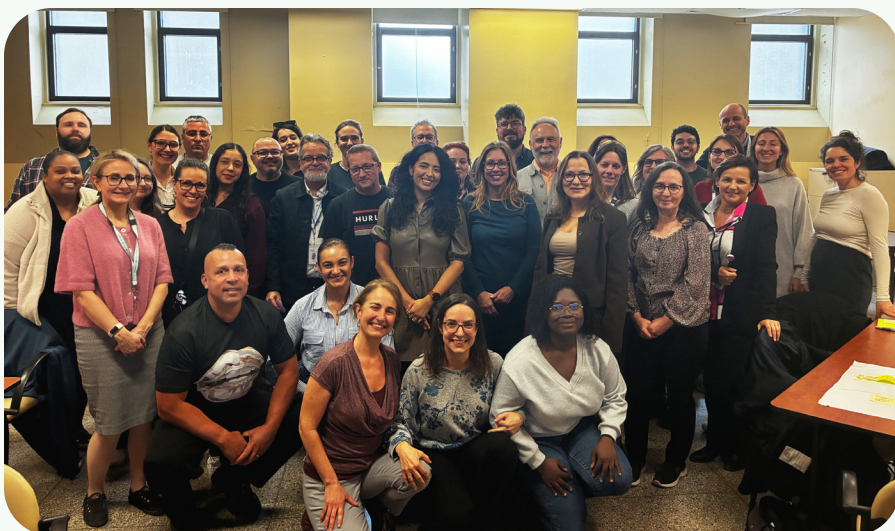
Les équipes du CIUSSS du Centre-Sud-de-l'Île-de-Montréal lors d'un atelier de réflexion